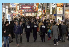
繁華街地域の査察