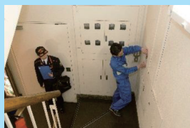
避難経路確保の指導