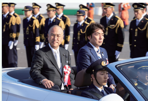
東京消防庁出初式に出席

東京都議会議員（4期）、 都議会警察・消防委員会副委員長 オリンピック・パラリンピック、 ラグビーワールドカップ日本大会を 成功させる議員連盟副会長、 早稲田大学招聘講師、住職